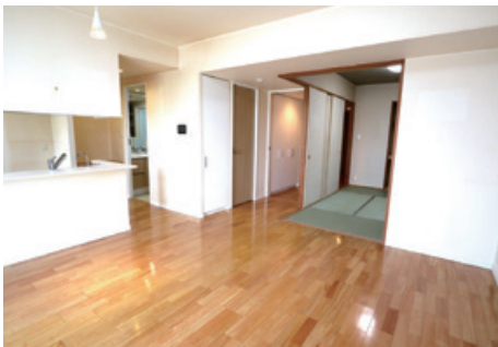
これからリフォームを待つリビング

10年ほどアパートで暮らしていますが、子供が大きくなり、物も増えていくにつれて手狭になってきました。部屋を持たせたいとも思っていましたので、ネットで賃貸も売買もあわせて探していました。ちょうどその頃に私好みのマンションの広告がポストインされました。対面キッチンで和室があり、今の住