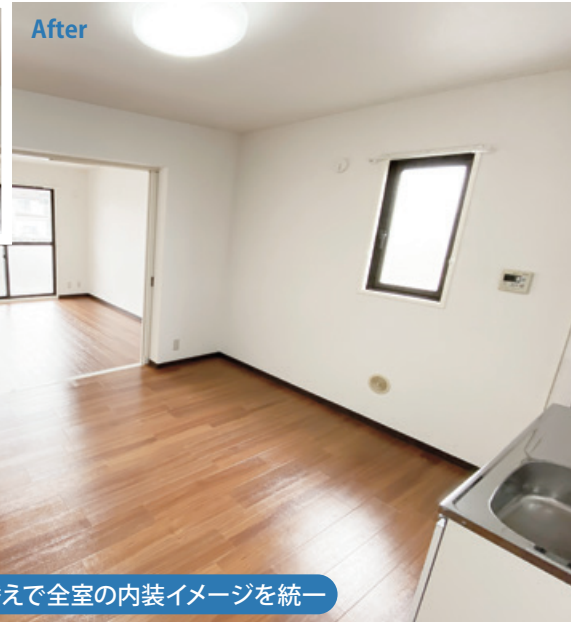
フロアタイル張替えで全室の内装イメージを統一