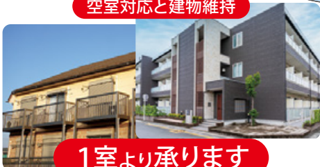
空室対応と建物維持