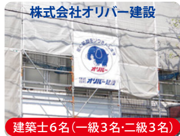
建築士6名(一級3名・二級3名)