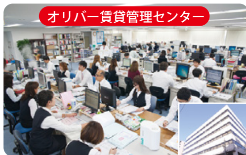
オリバー賃貸管理センター