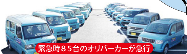
緊急時85台のオリバーカーが急行