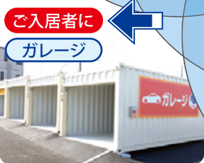
ご入居者に ガレージ